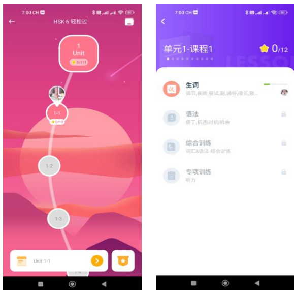
Hình 2. SuperTest cung cấp cho người học một lộ trình học tập rõ ràng dựa trên kết quả bài kiểm tra trình độ đầu vào

HSK 轻松过 là chức năng giúp cho người học dễ dàng học tập theo lộ trình thích hợp. Mỗi một bước sẽ là một 单元 (đơn vị bài học) với nội dung học tập thích hợp. Người học trước tiên phải hoàn thành việc học theo từng bước cố định, đầu tiên là học từ vựng, sau đó mới học ngữ pháp, tiếp đến là làm bài tập tổng hợp và làm bài tập theo chuyên đề. Chỉ khi hoàn thành xong bước ban đầu mới có thể mở khóa và đi tiếp bước tiếp theo. Điều này làm cho người học dễ dàng dung nạp kiến thức, tránh tình trạng bỏ bước, gây nhầm lẫn hay thiếu hụt kiến thức. Đây là chức năng vô cùng hữu ích, nếu người học nghiêm túc học tập theo lộ trình định ra, họ sẽ dễ dàng thông qua kỳ thi năng lực Hán ngữ HSK ở cấp độ mục tiêu. Từ vựng ở mục HSK 轻松过 được giải thích theo hướng tương đối hoàn chỉnh. Đầu tiên, mỗi một từ vựng đều bao gồm từ loại, phiên âm kèm theo ví dụ về cách sử dụng. Ngoài ra, mỗi từ vựng đều có kèm phần phát âm, giúp cho người học dễ dàng nghe phiên âm và học theo, tránh tình trạng phát âm sai. Không chỉ có vậy, SuperTest còn tích hợp tính năng phiên dịch qua nhiều loại ngôn ngữ, giúp người học dễ dàng chọn ngôn ngữ phù hợp và học tập một cách hiệu quả hơn.