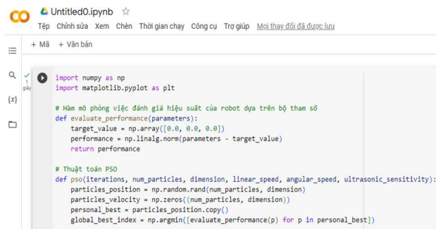
Hình 1. Sử dụng công cụ trên colab viết lập trình python

Chúng ta có thể sử dụng ngôn ngữ lập trình Python để mô phỏng quá trình tối ưu hóa bằng PSO và ứng dụng vào việc điều khiển robot bằng sóng hồng ngoại. Mã lập trình Python có thể giúp thấy rõ cách chương trình tương tác với các cá thể (particles), cập nhật vị trí và vận tốc, cũng như đánh giá hiệu suất của robot với các bộ tham số khác nhau (hình 1).