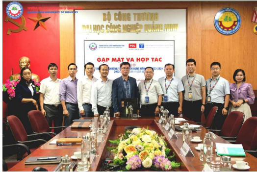
Nhà trường gặp mặt và hợp tác với Công ty TNHH Kỹ thuật điện tử TONY - TLC