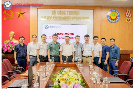
Nhà trường trong cuộc họp về hợp tác NCKH và chuyển giao công nghệ với Công ty TNHH Công ty TNHH Đầu tư và Thương mại Quang Minh