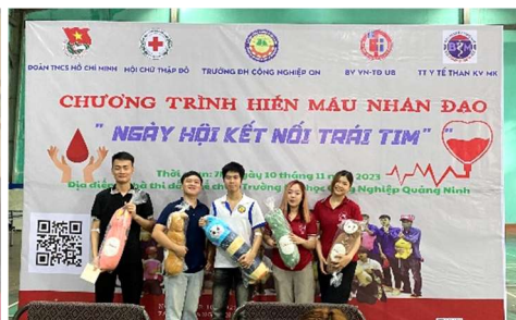
Ngày hội hiến máu nhân tạo tại Trường