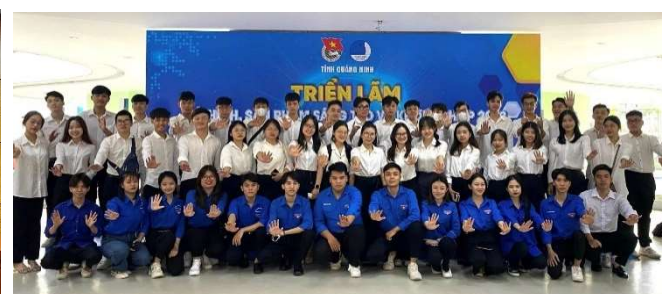
Tập huấn kỹ năng số cho SV Nhà trường