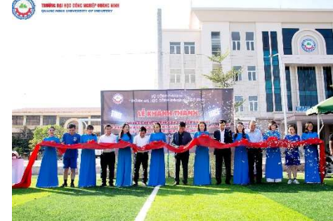
Trường ĐH Công nghiệp Quảng Ninh tổ chức Lễ cắt băng khánh thành Nhà điều hành A2 và O2 sân bóng cỏ nhân tạo