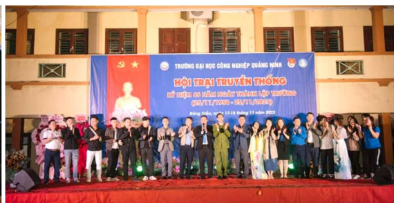
Hội trại truyền thống chào mừng 65 sinh nhật Trường