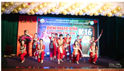
Nhạc hội chào Tân SV K16