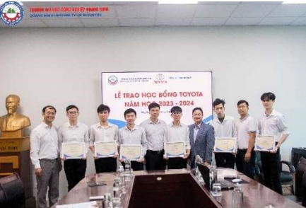
Lễ trao Học bổng TOYOTA và Học bổng năng lượng tương lai cho SV Nhà trường